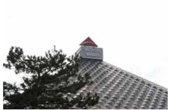
Abb.: Die IM.TOP 2005 in der „Pyramide“ in Vösendorf